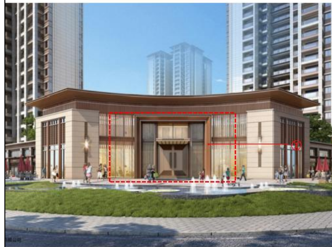
方案调整前效果图：