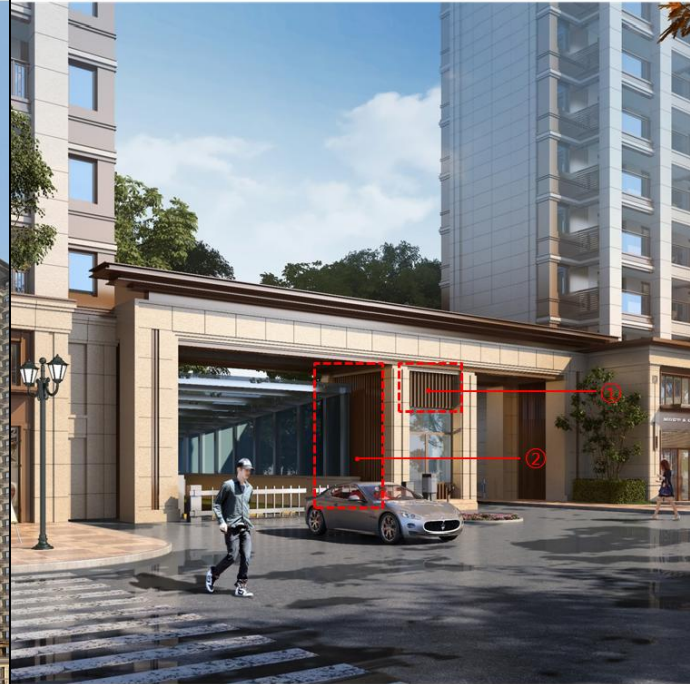
方案调整前效果图：