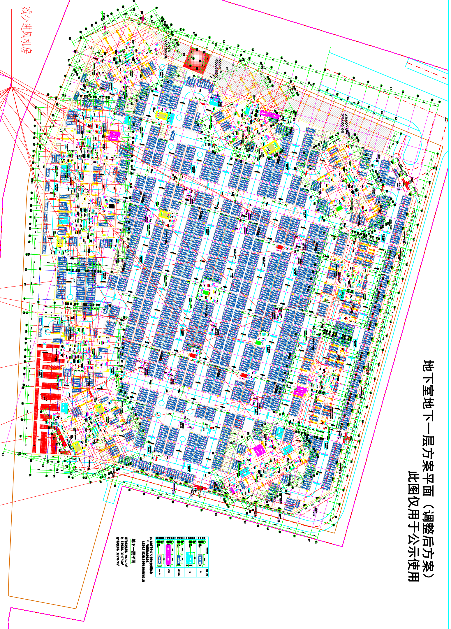
地下室地下一层方案平面 (调整后方案) 此图仅用于公示使用