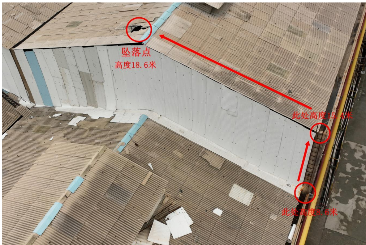
图七 厂房棚面情况