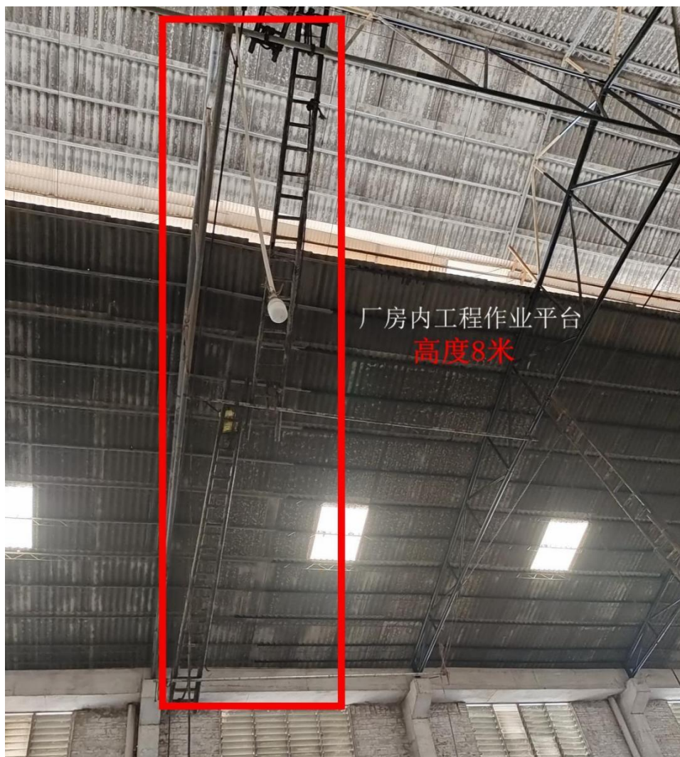
图一 厂房内作业平台

恩平市景业陶瓷有限公司（简称景业公司，下同）与佛山市南海华穗防水防锈工程部（简称华穗工程部，下同）合同约定工期从2月8日起，为期45天，但实际开工日期为4月4日，由于赶工期，4月5日清明节当天华穗工程部施工队正常开工。该工程项目开工前，景业公司并未按照沙湖镇政府关于外协单位进厂作业要提前报备的要求向镇政府应急办进行报备。