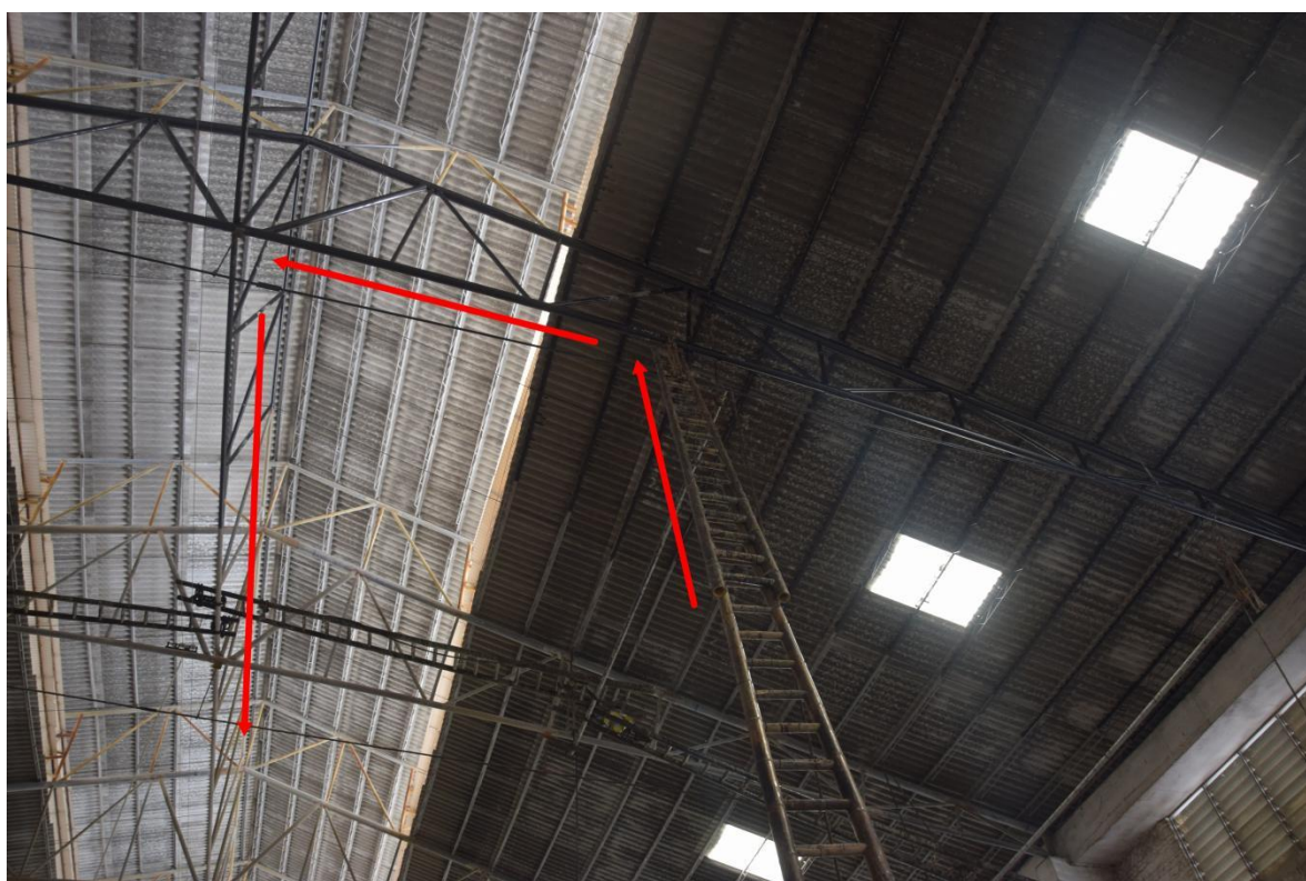
图三 作业人员行进路线 2