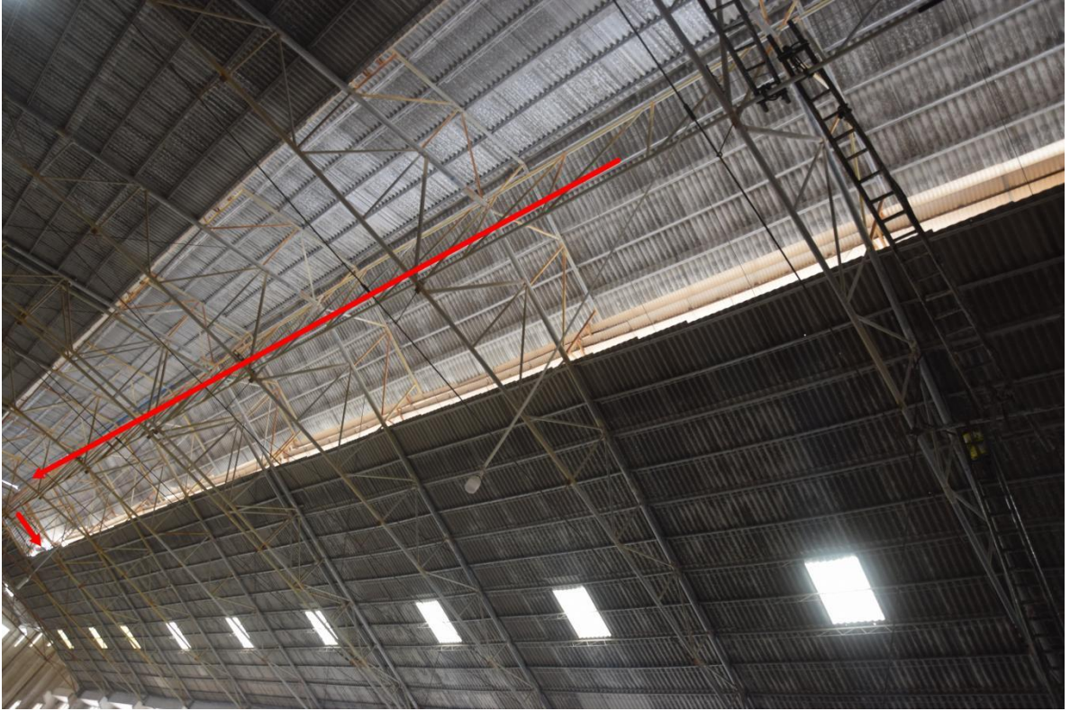
图四 作业人员行进路线 3