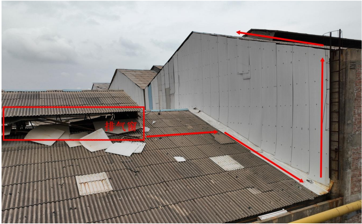
图六 作业人员棚面行进路线