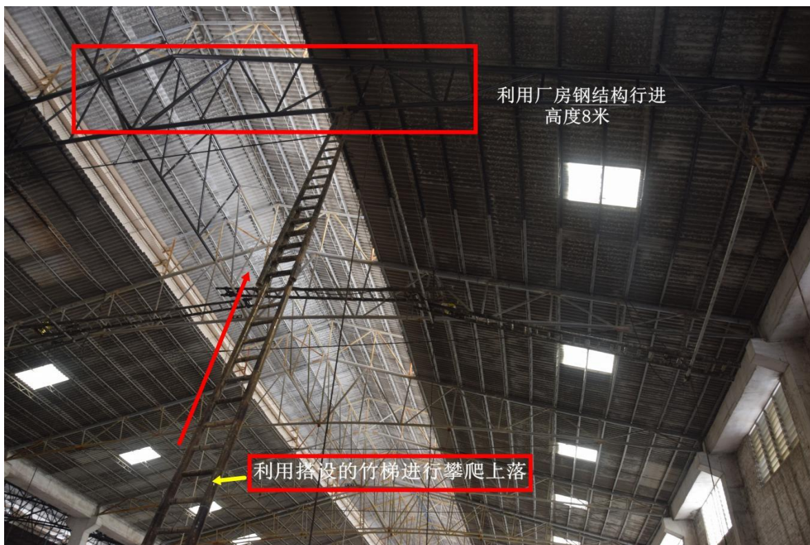
图二 作业人员行进路线 1